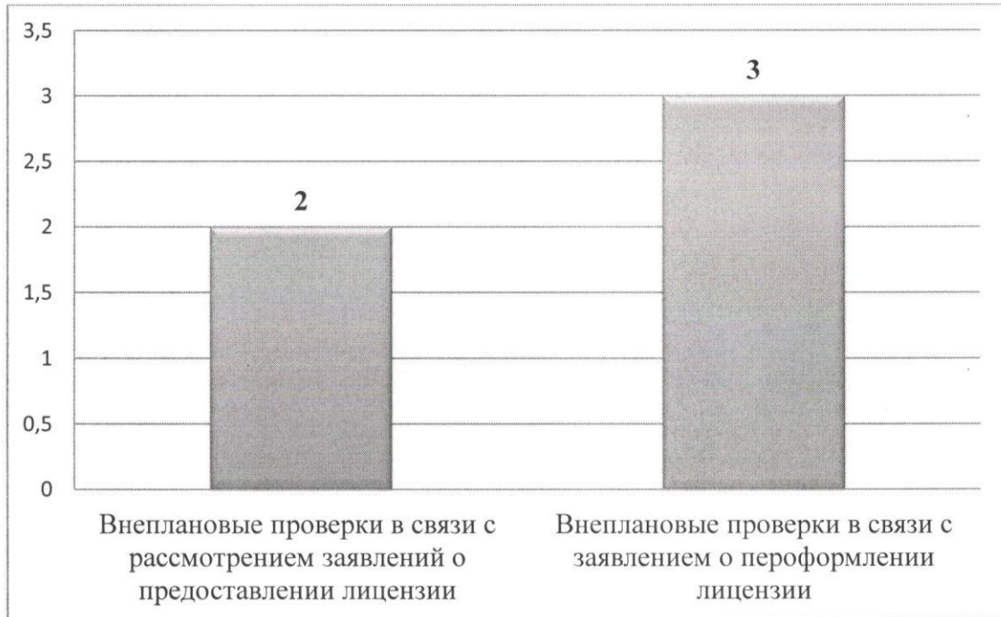
Рисунок 3. Количество внеплановых проверок по основаниям процедуры лицензирования.

(лицензиатом) при осуществлении образовательной деятельности, а также наличия необходимых для осуществления образовательной деятельности педагогических работников лицензионным требованиям осуществлены в отношении 4 юридических лиц и 1 индивидуального предпринимателя (проведено 5 внеплановых выездных проверок).